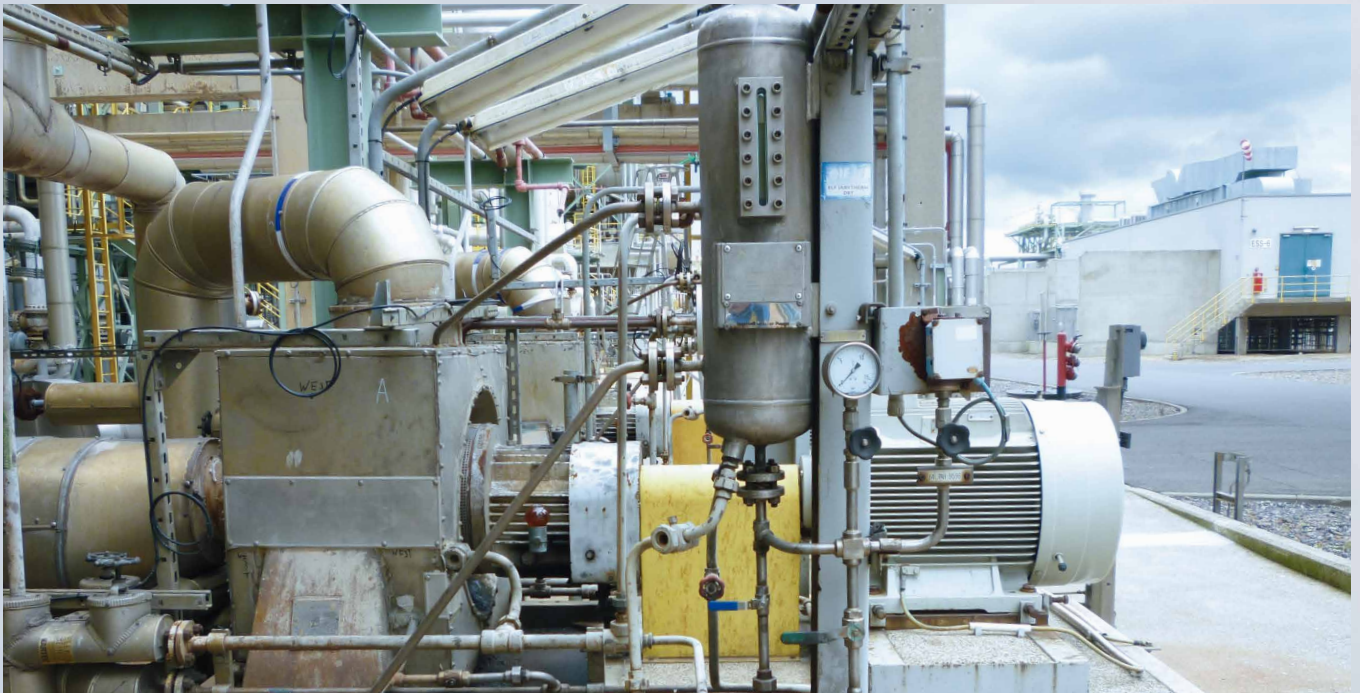
IDP-Pumpe mit Dichtungsversorgungseinheit im Einsatz bei TOTAL Leuna.

Die TOTAL Raffinerie am Chemiestandort Leuna ist eine der modernsten Anlagen ihrer Art in Europa. Täglich werden ca. 30.000 Tonnen Rohöl verarbeitet, das überwiegend aus russischer Förderung stammt.